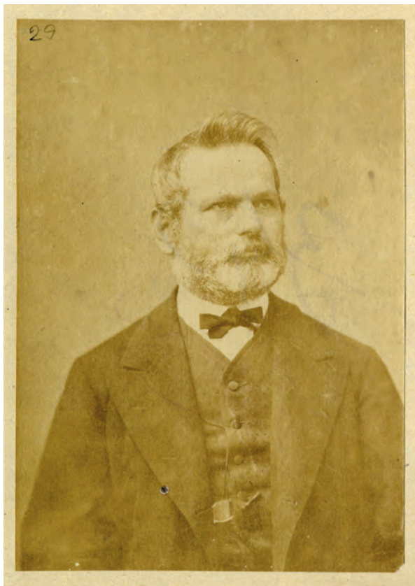
■ Kerkápoly Károly (1824–1891) jogi doktor, egyetemi tanár, a Magyar Tudományos Akadémia levelező tagja, pénzügyminiszter (1870–1873), kb. az 1870-es években

tésével néhány alsó-ausztriai kerületet meglátogatnak, és helyben az addigi eredményekbe betekinthez, szeptember 1-jén pedig Friedrich Elsner miniszteri tanácsost elkísérheti a karintiai ellenőrző útján. 23